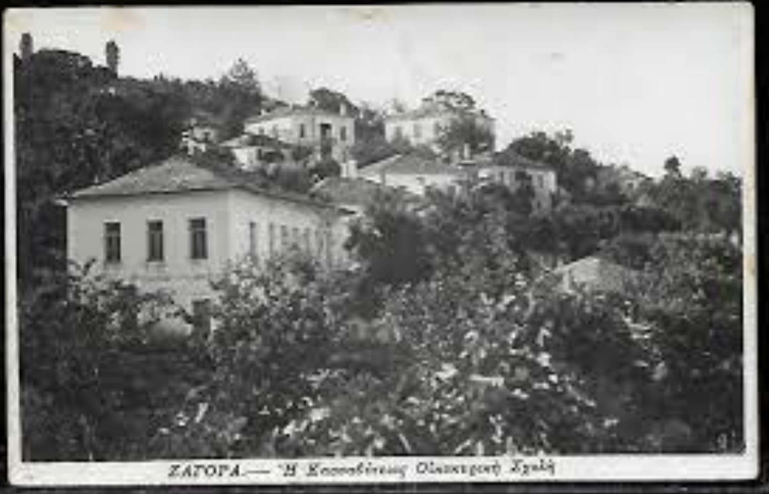
ΣΑΓΟΡΑ.— Ἡ Κασσαβίτικη Διακεκοπὴ Σχολή